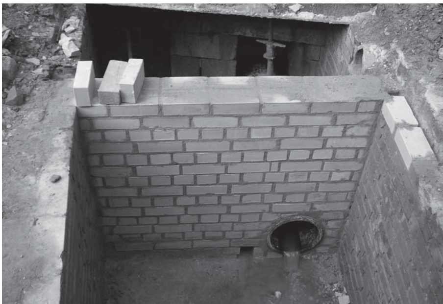
Sanierung des Schachtbauwerkes vor der Bahnquerung Nelkenweg

Die Haltung der Bahnquerung wurde hier im Rohr-in-Rohr-Verfahren, durch Einzug von 400 mm Rohren, erneuert. Diese Rohre wurden im alten Steindeckerkanal zentriert und die Hohlräume zwischen Altkanal und Neurohr mit